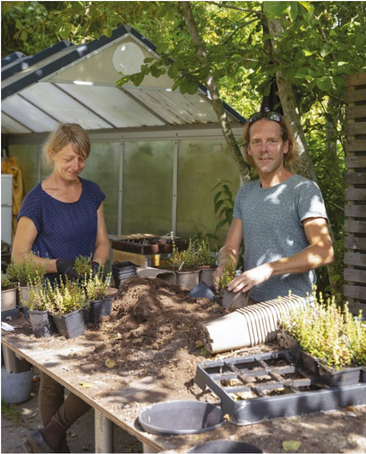
Tijm oppotten aan de oppottafel.