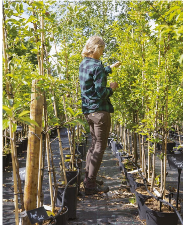
Controle van de vruchtbomen.