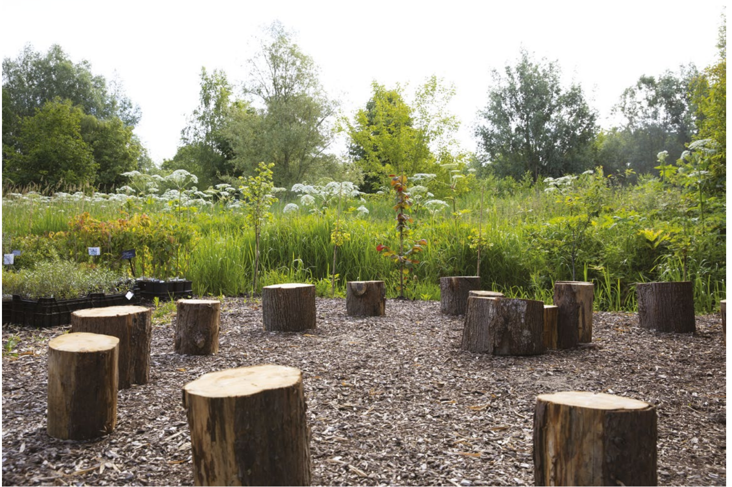
Boomstammetjes om even uit te kunnen rusten na een rondleiding.